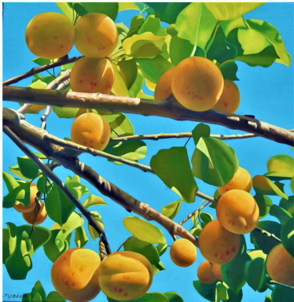
Julio Padrón Albaricoques