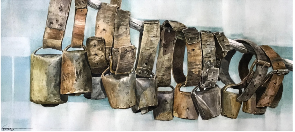
Cristóbal Garrido (Toba)